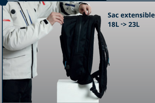
Sac extensible 18L -> 23L