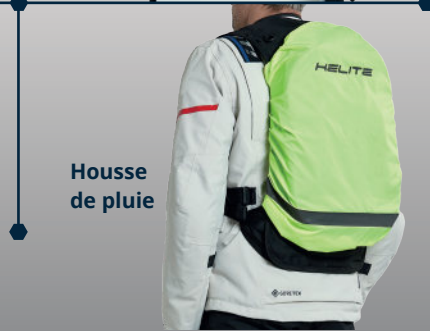
Housse de pluie