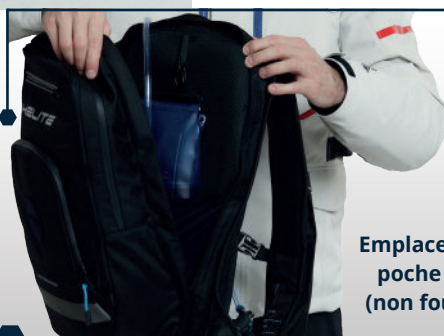
Emplacement poche à eau (non fournie)